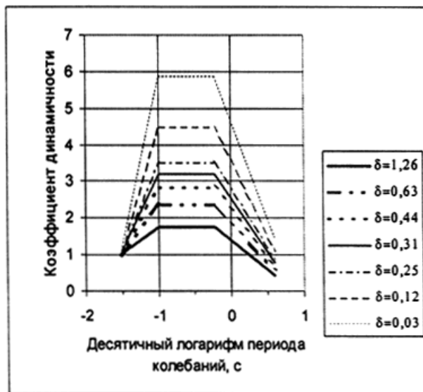
Рис.П.3.1. Спектры коэффициентов динамичности для различных логарифмических декрементов колебаний \delta

Примечание. Ординаты спектра реакции синтезированной акселерограммы не должны отклоняться от ординат стандартного спектра более чем на 10%.